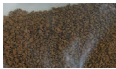
←インスタント コーヒー