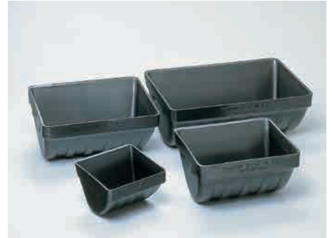
ナイロン ® バケット