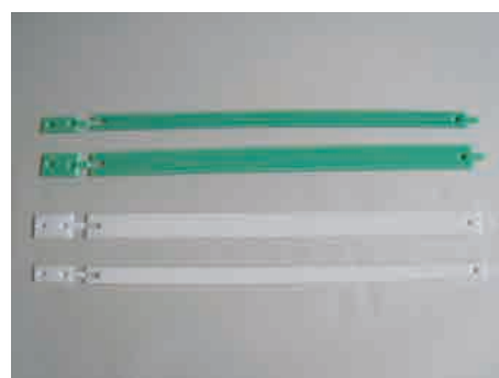
左：エンドプレート 右：PHレール