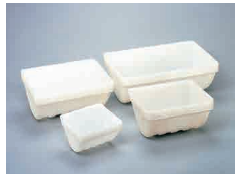
ポリプロピレン (PP) バケット