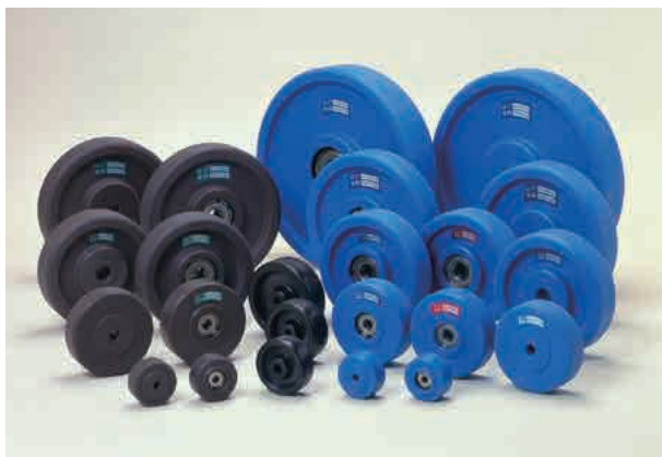
MC-VN (左) MC-VS (中) MC-VB (右)